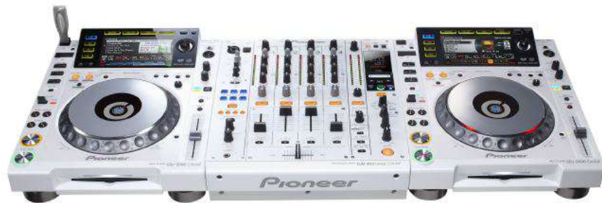
Pioneer DJM900NXS W + 2x Pioneer CDJ2000 W Pioneer DJM800 + 2x Pioneer CDJ900 K