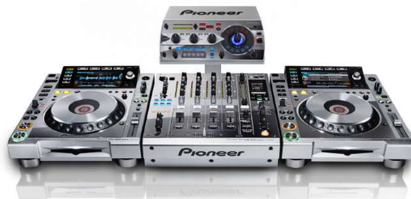
Pioneer DJM900NXS M + 2x Pioneer CDJ2000 M + Pioneer RMX1000 M Pioneer DJM900NXS K + 2x Pioneer CDJ2000 K